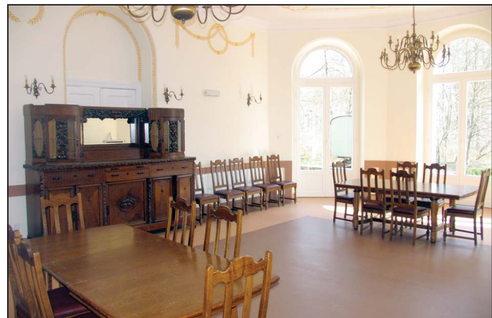
Najładniejsze i największe pomieszczenie w pałacu zostało wyłożone antypoślizgową posadzką.

większą ubiegłoroczną inwestycją remontową Powiatu Kościańskiego. Realizacja tego remontu było możliwa między innymi dzięki wsparciu, które w wysokości ponad 930 tys. złotych otrzymaliśmy ze środków Państwowego Funduszu Rehabilitacji Osób Niepełnosprawnych - mówi