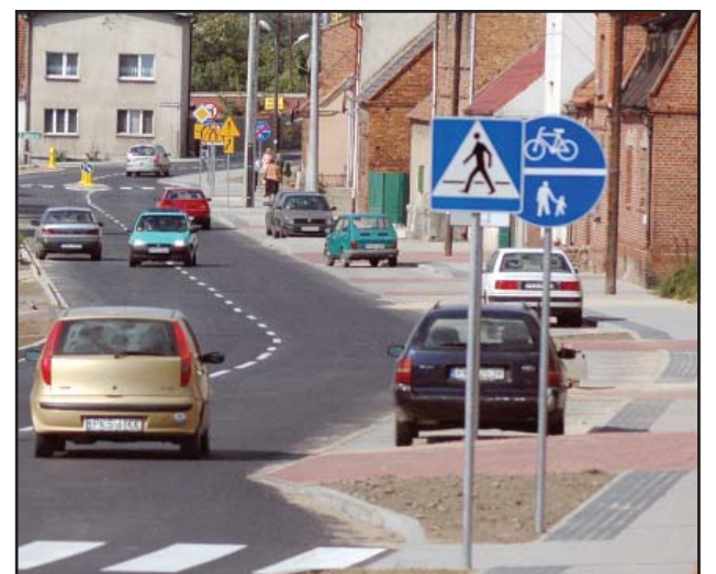
Samochodów w naszym powiecie jest z każdym rokiem więcej.

Pojazdy samochodowe – sztuki - w Powiecie Kościańskim według grup wieku – stan w dniu 31. 12. 2007 roku. bj