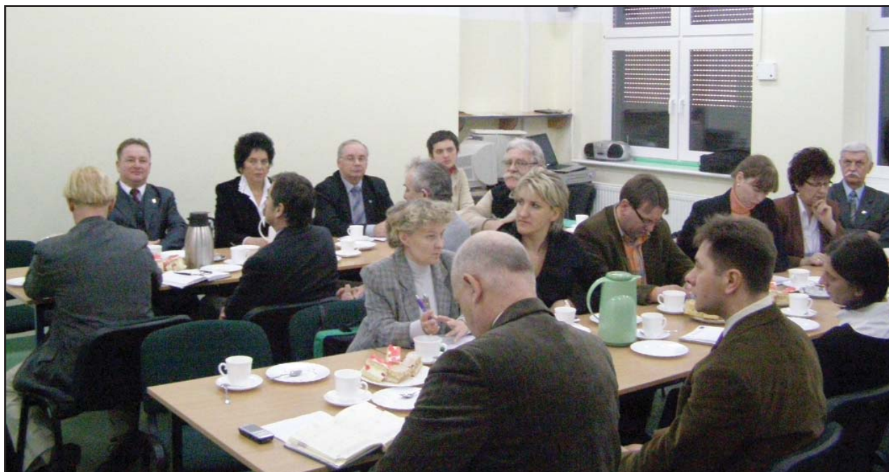
Warsztaty w Starych Oborzyskach

Gmina: 065 512 10 01; e-mail:sekretariat@gminakoscian.wokiss.pl; Internet: www.gminakoscian.wokiss.pl