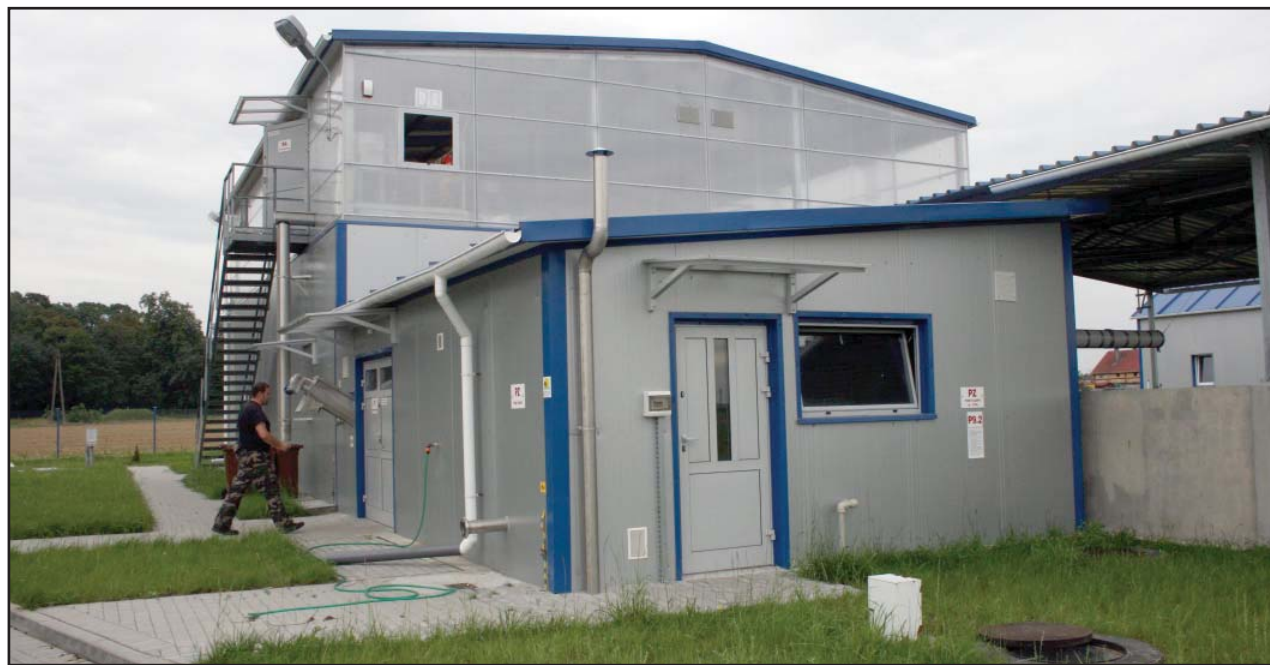
Oczyszczalnia w Starych Oborzyskach

Wypracowane cele i zadania zostaną wpisane do Lokalnej Strategii Rozwoju na lata 2008-2013 i pozwolą na sięganie po fundusze unijne na ich realizację. (md)