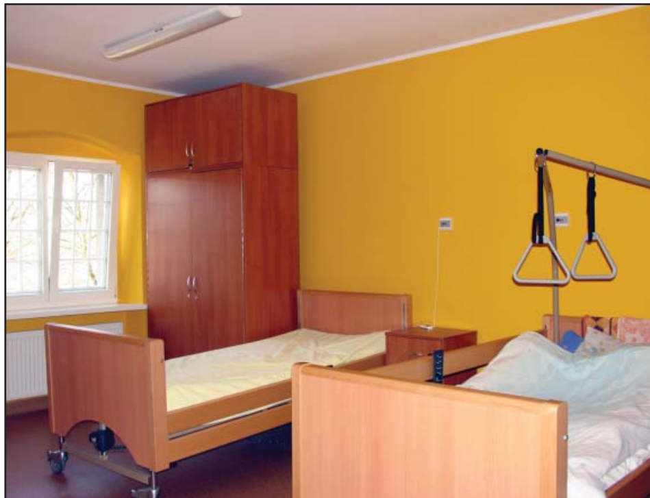
We wszystkich pokojach są nowe meble.