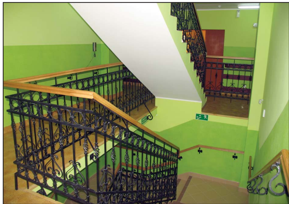
Główna klatka schodowa została poszerzona, a jaskrawe kolory ułatwią osobom ze słabym wzrokiem codzienne funkcjonowanie.