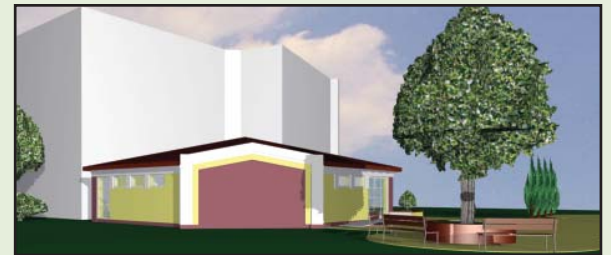
Wizualizacja nowego budynku od strony boiska. Projekt Izabela Wrześniewska

Jak informowaliśmy, w tym roku największą budowlaną inwestycją Powiatu Kościańskiego jest rozbudowa Liceum Ogólnokształcącego w Śmiglu. W marcu został rozstrzygnięty przetarg na wykonawcę tej inwestycji. Prace wykona Przedsiębiorstwo Budowlane BUDOMONT z Kościana. Koszt inwestycji, która zostanie sfinansowana ze środków budżetu powiatu wyniesie, łącznie z kosztami nadzoru budowlanego 550 tys. złotych. Prace budowlane rozpoczną się 7 kwietnia i potrwają do 14 sierpnia 2008 roku.