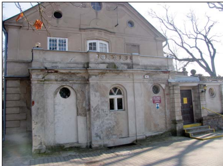
Budynek, w którym do niedawna była administracja Domu będzie remontowany.