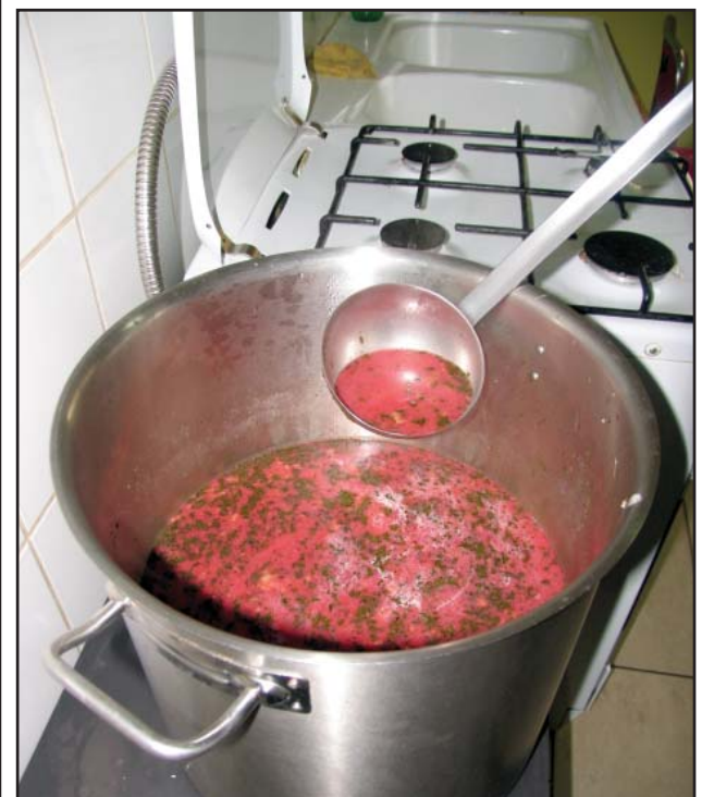
Osoby potrzebujące od listopada 2007 mogły posilić się ciepłą zupą.

Wydawanie posiłków zostanie wznowione w listopadzie tego roku. Pracownicy Ośrodka i Punktu Pomocy Żywnościowej mają nadzieję, że sponsorzy ich nie opuszczą. bj