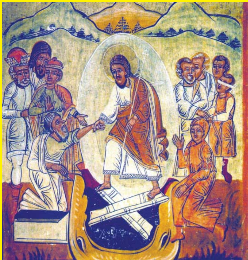
Zstąpienie do otchłami - fragment ikony Męki Pańskiej z Welykiego 1593 r., Deska Lipowa, tempera, Muzeum Narodowe we Lwowie

Niechaj zwycięstwo dobra nad złem i życia nad śmiercią, będące przesłaniem nadchodzących Świąt Wielkanocnych, stanie się dla Państwa źródłem radości i nadziei.