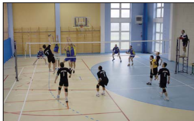
Fragment meczu Racot I – Taverna Kościan.

- W Kościanie obowiązki właścicieli zwierząt reguluje „Regulamin utrzymania czystości i porządku na terenie miasta”. W myśl zawartych tam zapisów, właściciel psa zobowiązany jest nie tylko do wyprowadzania go na smyczy, ale także do usuwania zanieczyszczeń pozostawionych przez psa z terenów przeznaczonych do wspólnego użytku za pomocą odpowiednich narzędzi, które powinien posiadać. Za nieprzestrzeganie tych obowiązków strażnik miejski może nałożyć na niego grzywnę w postaci mandatu w wysokości od 20 do 500 złotych lub skierować wniosek o ukaranie do Sądu Rejonowego w Kościanie. W marcu Straż Miejska rozpoczęła akcję „Porządek”, w ramach której szczególną uwagę będziemy zwracać na to, czy właściciele zwierząt wywiązują się ze swoich obowiązków.