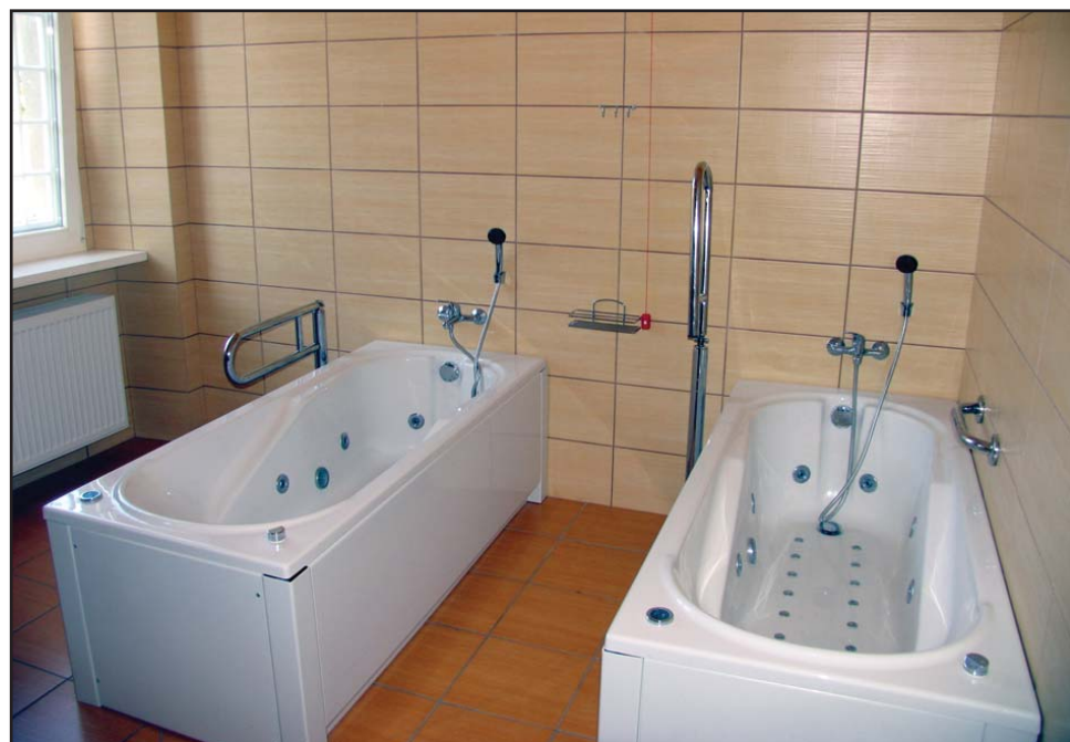
Wyremontowane łazienki przystosowano do potrzeb osób niepełnosprawnych.