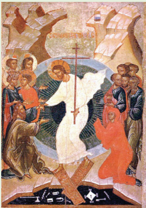
Zstąpienie do otchłani, ikona nowogrodzka II połowa XV wieku deska lipowa.

Życzymy Państwu, by radość i pogoda ducha towarzysząca Świętu Zmartwychwstania Pańskiego była źródłem wiary w sens życia i ukojeniem dla trudów codzienności.