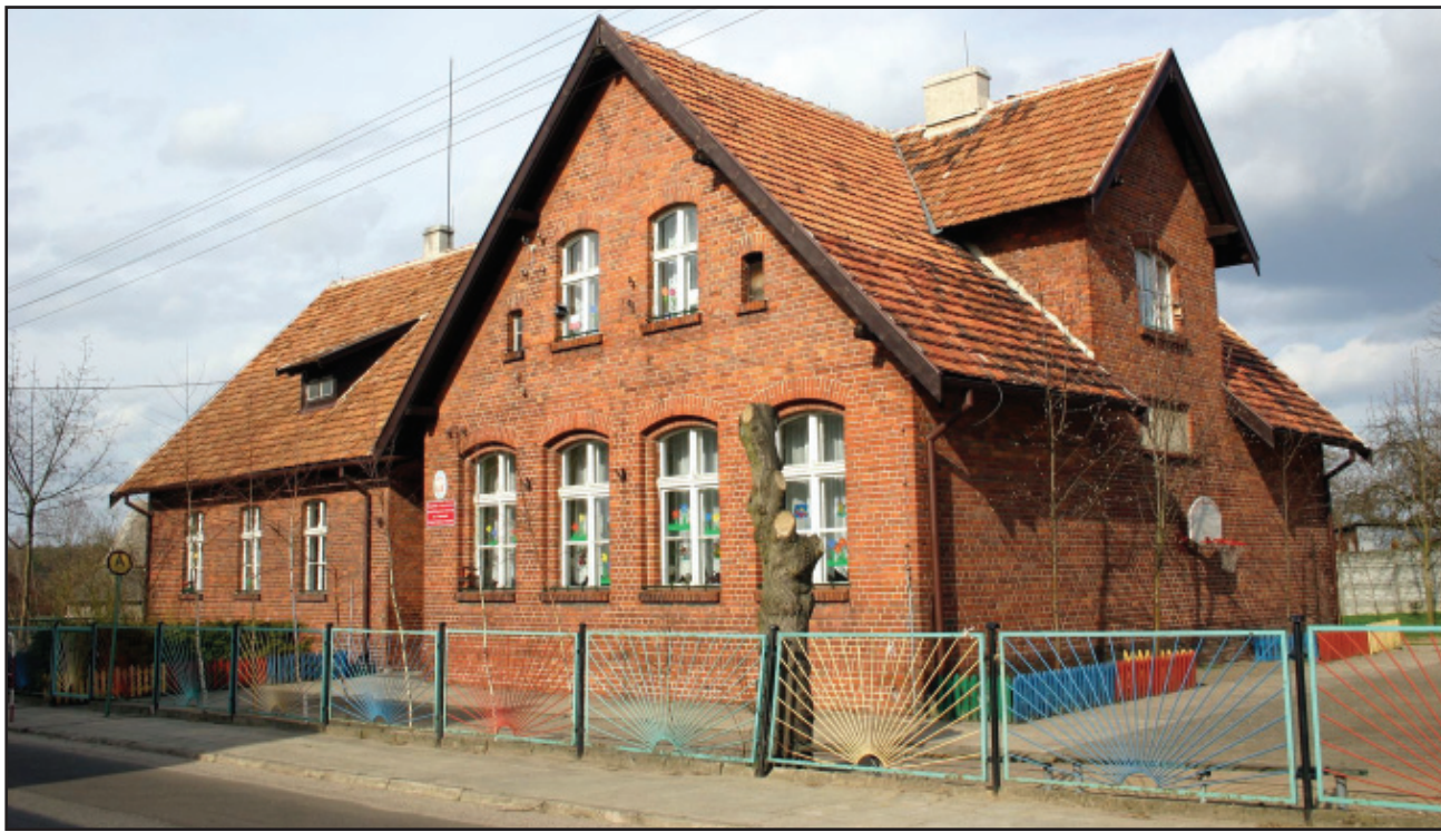
Budynek szkoły w Gryżynie