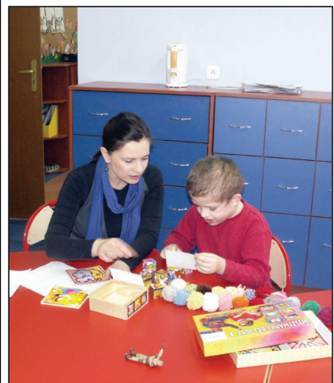
Zapraszamy rodziców i dzieci do skorzystania z szansy jaką daje Zespół Wczesnego Wspomagania Rozwoju Dziecka.

Rodzice, którzy byliby zainteresowani tym, aby ich dzieci znalazły się pod opieką Zespołu Wczesnego Wspomagania muszą w pierwszej kolejności uzyskać w Poradni Psychologiczno-Pedagogicznej opinię o potrzebie wczesnego wspomagania rozwoju dziecka. Mając taką opinię mogą udać się do Zespołu Szkół im. M. Konopnickiej.