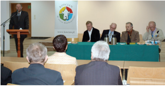
Uczestnicy spotkania doszli do wspólnych wniosków istnienia potrzeby wszechstronnej współpracy naukowców z kadrą dydaktyczną.