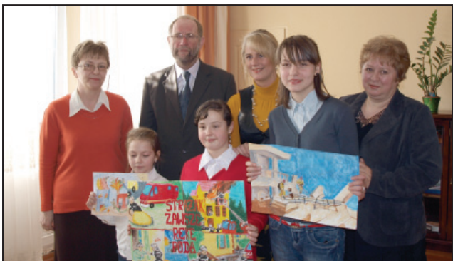
Burmistrz Miasta Kościana pogratulował laureatom oraz ich opiekunom udziału w konkursie

Pozostali uczestnicy konkursu otrzymali od Burmistrza Miasta Kościana pamiątkowe dyplomy, słodczyce oraz poradniki wydane przez Wydział Zarządzania Kryzysowego Wielkopolskiego Urzędu Wojewódzkiego w Poznaniu.