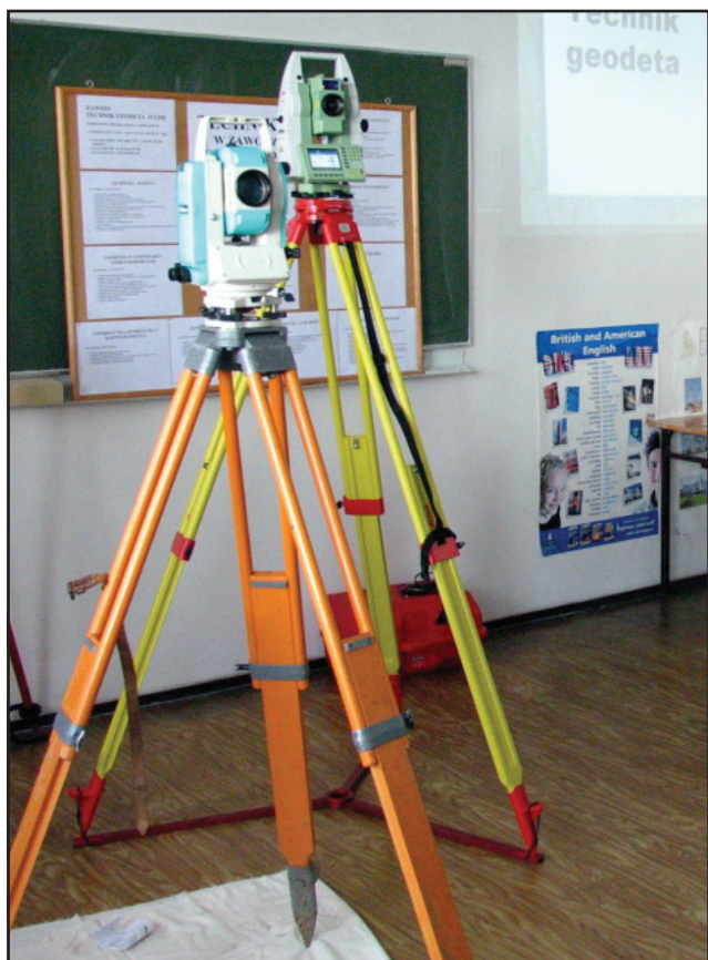
Od 1 września w szkole będą uczyli się geodeci i gazownicy.

Warto zapoznać się z ofertą edukacyjną Zespołu Szkół im. Franciszka Ratajczaka w Kościanie. W tym celu można odwiedzić szkołę osobiście lub zajrzeć na jej stronie internetowej www.zsp-kościan.pl . bj