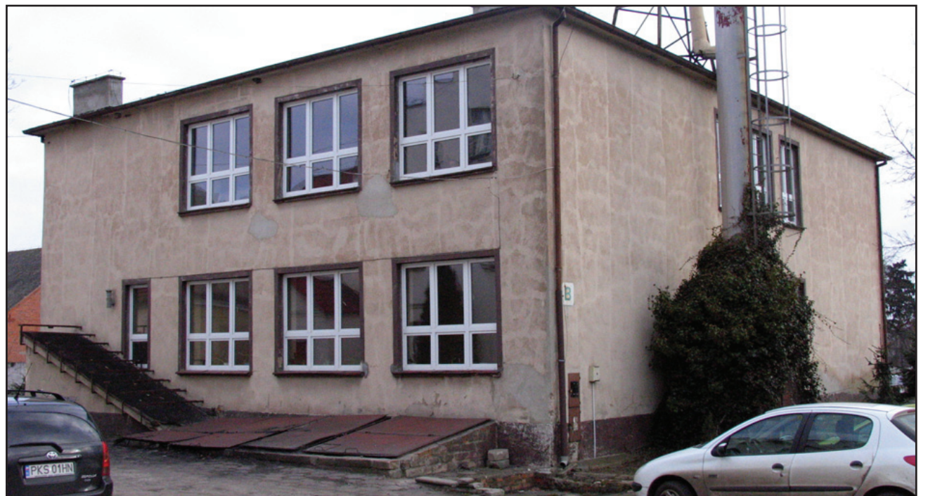
W ramach termomodernizacji szkoły w Nietązkowie zostanie zlikwidowana stara kotłownia.

Wszyscy uczestnicy konkursu otrzymali nagrody i pamiątkowe dyplomy. mr