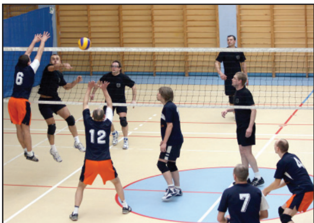
Fragment meczu Tawerna – Kalos-Kagathos