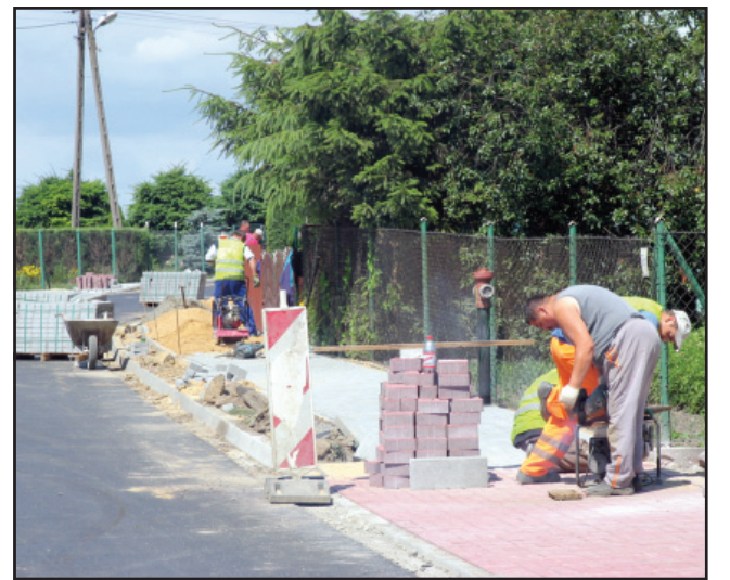
W Jurkowie i Świńcu dobiegają końca prace przy układaniu chodników.

W przypadku drugiej inwestycji, przebudowy drogi powiatowej z Gryżyny do Krzywina prace są bardzo zaawansowane. Na całym 11 kilometrowym odcinku drogi zostały już odwodnione rowy, wzmocnione pobocza i wyłożona nowa nawierzchnia bitumiczna. Obecnie dobiegają końca prace przy przebudowie chodników w Jurkowie i Świńcu. Ponadto w Januszewie i Jurkowie powstaną wyniesione przejścia dla pieszych. W miejscach niebezpiecznych zamontowane zostaną bariery energochłonne. Na przebudowę tej drogi starostwo pozyskało zewnętrzne wsparcie w wysokości ponad 1 milion 964 tys. złotych. Taka sama kwota będzie pochodziła z budżetu powiatu kościańskiego. Powiat wesprą gminy Kościan i Krzywiń. Koszt prac to 3 miliony 929 tys. złotych. Głównym wykonawcą inwestycji jest poznański oddział firmy SKANSKA S.A. bj