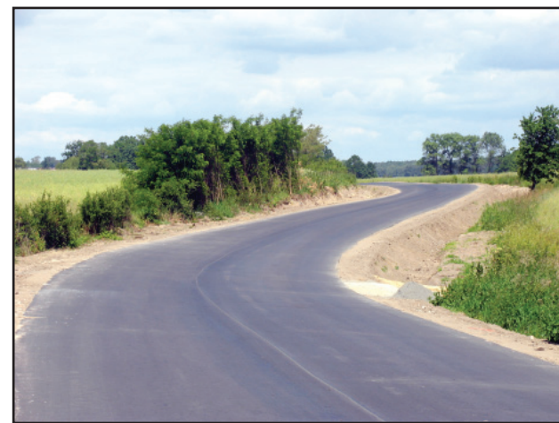
Droga została poszerzona.

Starostwo pozyskało na inwestycję kwotę ponad 3 milionów 766 tys. złotych. Wartość prac, które zostaną wykonane wyniesie ponad 7 milionów 603 tys. złotych. Inwestycje wesprze również Gmina Kościan. Prace wykonuje Przedsiębiorstwo Dróg i Ulic Leszno sp. z o. o.