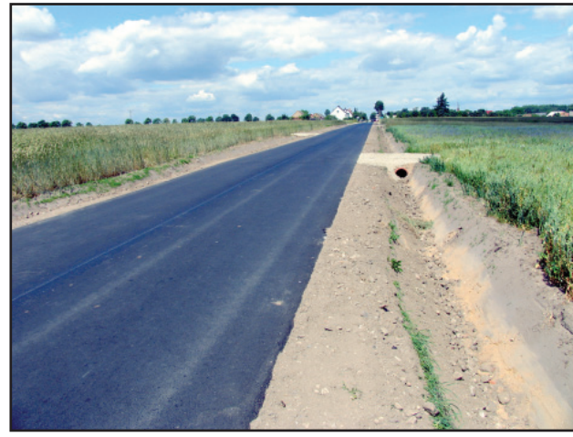
Na drodze Gryżyna – Krzywiń zakończono układanie nowej nawierzchni bitumicznej.

już wyremontowana nawierzchnia. W dalszej kolejności prace będą prowadzone na drodze w stronę Widziszewa. Nowa nawierzchnia bitumiczna zostanie położona na odcinku 5 kilometrów. Jest to największa, tegoroczną inwestycją powiatu.