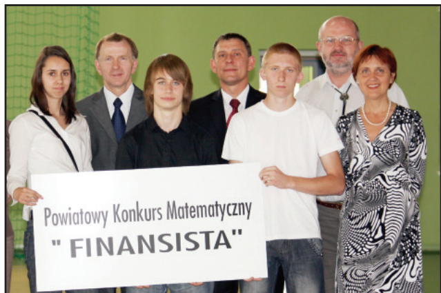
Laureaci i sponsorzy tegorocznego konkursu matematycznego.