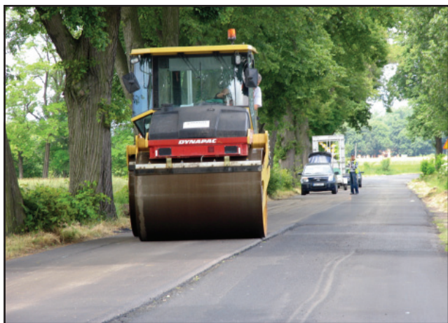
Droga Czempień-Borowo będzie wyremontowana na odcinku prawie 3 kilometrów.

zjum zostanie zbudowany nowy chodnik. Przy gimnazjum powstanie wyniesione, bezpieczne przejście dla pieszych oraz zejście – rampa dla wózków i schody - ze skarpy. Ponadto na prawie 3 kilometrowym odcinku drogi z Czempienia do Borowa zostanie ułożona nowa nawierzchnia bitumiczna. W Borowie zostanie odbudowana zatoka autobusowa i pobudowane miejsce postojowe przed szkołą podstawową. Koszt prac, które już się rozpoczęły wyniesie ponad 689 tys. złotych brutto. Prace, które potrwać do początku sierpnia wykonuje Przedsiębiorstwo Drogowo-Mostowe DROMOST Sp. z o. o. z Brodnicy. bj