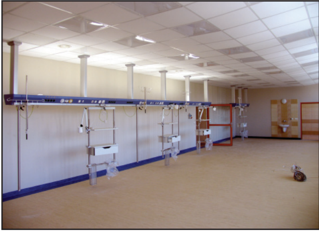
Nowoczesny oddział intensywnej opieki medycznej czeka na sprzęt i meble. Trwa procedura przetargowa na ich zakup.