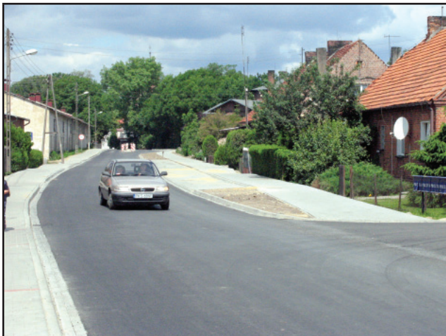
Koszt remontu drogi Czacz – Widziszewo to ponad 7 milionów 603 tys. złotych.