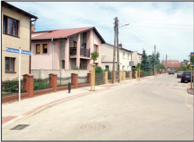
Ulica Niemcewicza o długości 350 mb ma już nową nawierzchnię z kostki betonowej wraz z chodnikami