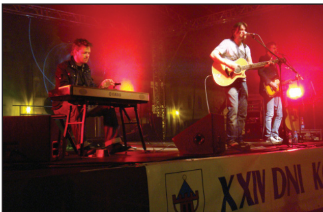
Ray Wilson był wokalista Genesis wykonał największe przeboje zespołu