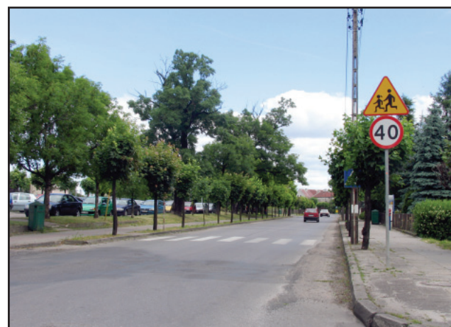
Ulica Kolejowa będzie miała nową nawierzchnię.