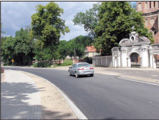
W Czaczu wyłożono nową nawierzchnię.

W Czaczu dobiegają końca prace przy układaniu chodników i ciągów pieszo-rowerowych. W całej miejscowości została