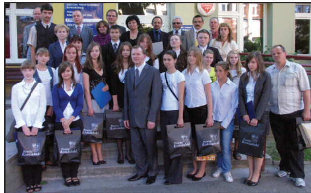
Stypendyści w towarzystwie starosty i wóldarzy gmin powiatu.

Powiat Kościański jest członkiem wspierającym Stowarzyszenia Oświatowe im. Dezyderego Chłapowskiego i pomaga w finansowaniu stypendiów dla młodzieży.