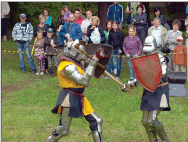
Stroje i pokazy rycerskie oraz prezentacje rzemiosła, przy zabytkowych murach miejskich tworzyły klimat epoki średniowiecza

W ostatni weekend maja odbyły się występy artystyczne uzdolnionej młodzieży szkolnej oraz zespołów tanecznych, konkursy przebiegaczy, kabaret, akrobacje rowerowe oraz pokazy rycerskie. Na kościańskim Rynku pojawiły się również stare syrenki i warszawy. W piątkowy i niedzielny wieczór odbyły się koncerty Oddziału Zamkniętego i wokalisty Genesis Ray'a Wilsona. W weekend od 11 do 13 czerwca Kościan po raz drugi był gospodarzem Festiwalu Aktywnego Ruchu Twórczego F-art podczas którego wystąpił m.in. Witold Pyrkosz w spektaklu „Eksperyment Adam i Ewa”. W sobotę wieczorem dla kościańskiej publiczności zaśpiewała Hanna Banaszak. Natomiast w ramach Kościan Klasyka 18 i 19 czerwca br. kościaniaczy słuchali muzyki klasycznej.