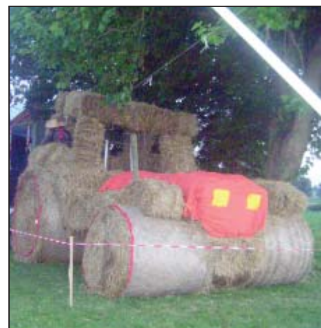
Symbol nowoczesnego rolnictwa

Pomimo faktu, iż tegoroczne plony nie były zadowalające w kilku wsiach rolniczej Gminy Kościan świętowano. Dożynki 2007 odbyły się do tej pory we Wławiu, Katarzyninie, Wyskoci, Naclawiu i Czarkowie. (md)