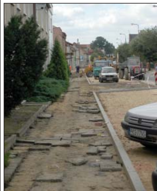
Ulica po remoncie będzie równie bezpieczna jak ulice Śmigielska i Surzyńskiego