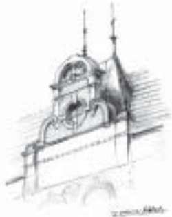
Przykład elementu architektury lokalnej

waloryzację przestrzeni publicznych, analizę krajobrazową, inwentaryzację funkcjonalną, koncepcję zagospodarowania ciągu spacerowego nad Obrą, fronty wodne. Uwagę zwraca piękne opracowanie jakim jest „Katalog charakterystycznych elementów architektury lokalnej”. Katalog pokazuje Kościan, jakiego często nie znamy lub nie zauważamy. Dla wielu to okazja, by spojrzeć na miasto z innej perspektywy, uzmysłowić, że są w tu wartości, które warto zachować, a ludziom nie znającym regionu pozwoli