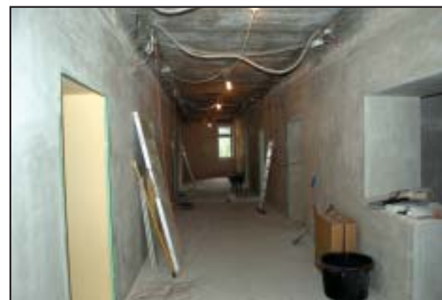
Trwają prace remontowe w szpitalu

PL – To był dla nas jeden z najważniejszych i najpilniejszych zakupów. Dzięki wsparciu zewnętrznemu, m.in. naszych samorządów, na przykład kwocie 500 tys. złotych z budżetu powiatu, za które dziękuję już w październiku będziemy mieli nowe urządzenie, a także co nas szczególnie cieszy nowoczesnie wyposażoną pracownię rentgenowską.