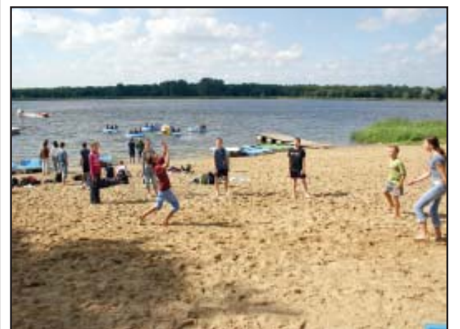
Rekreacja w Nowym Dębcu