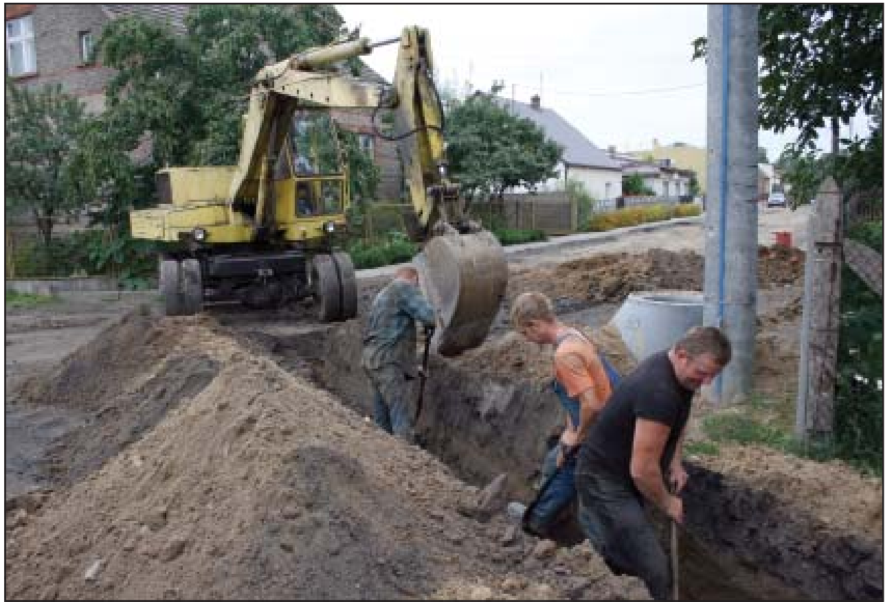
Prace na ulicy Torowej w Starych Oborzyskach.

W przyszłym roku zostanie wybudowana kanalizacja sanitarna z przykanalikami i przepompowniami ścieków w Bonikowie. (md)