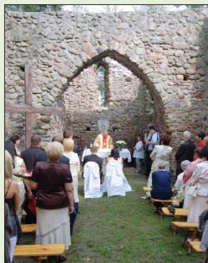
Ślub w ruinach Św. Marcina.