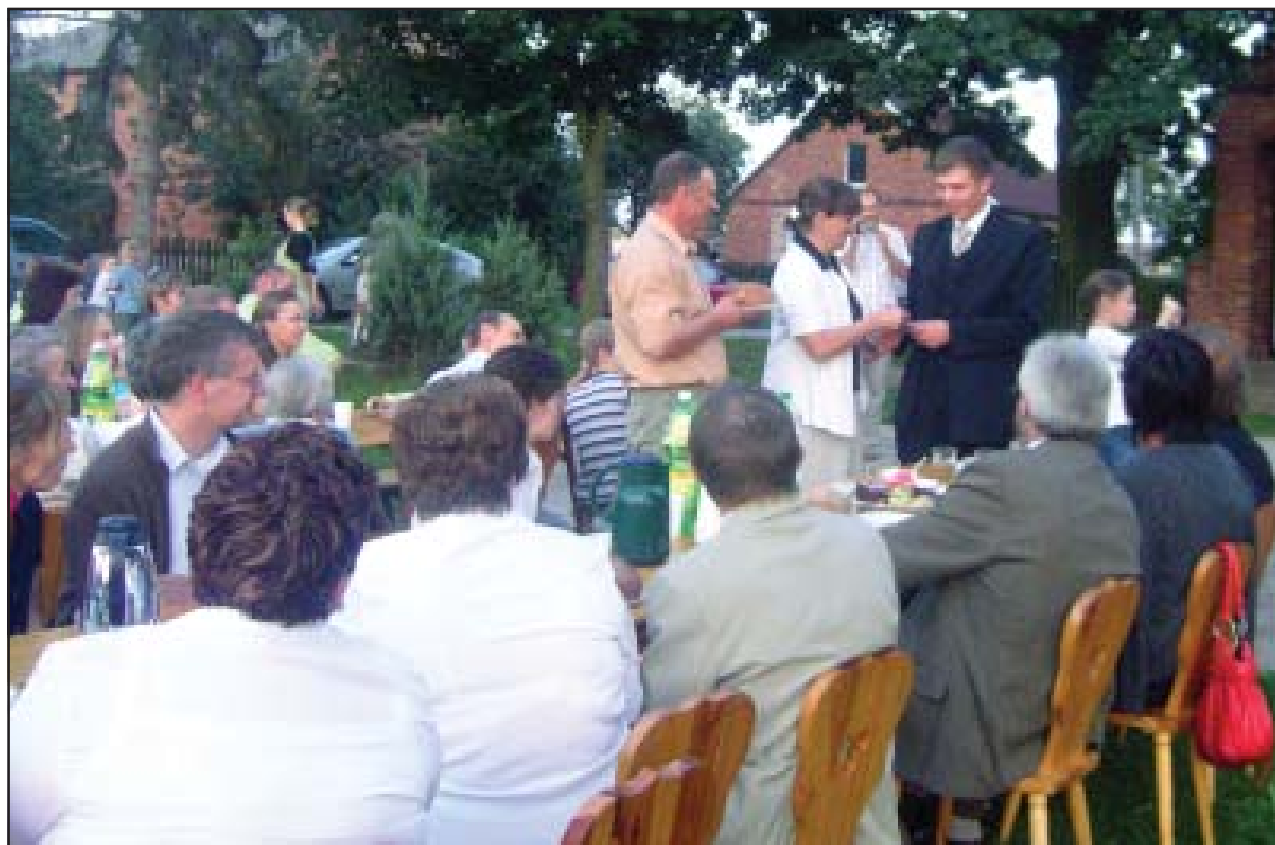
Dożynki we Wławiu

Gmina: 065 512 10 01; e-mail:sekretariat@gminakoscian.wokiss.pl; Internet: www.gminakoscian.wokiss.pl