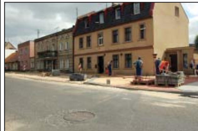
Prace potrwać do końca października

Inwestycje w Lubiniu oraz na ulicy Poznańskiej to kolejne, duże projekty drogowe realizowane przez Powiat Kościański – mówi Andrzej Jęcza, Starosta Kościański – mając na uwadze poprawę bezpieczeństwa oraz komfortu podróżujących drogami powiatowymi, staramy się sukcesywnie modernizować nasze drogi. Prace, jakie prowadzimy przyczyniają się także do poprawy estetyki miast i wsi powiatu. Dowodem na docenienie naszych starań jest umiejscowienie planu drugiej serii filmu „Eksperyment życie” z Krzysztofem Hołowczycem w Kościanie. mr