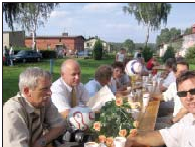
Uroczystości 40-lecia LZS Gryżyna