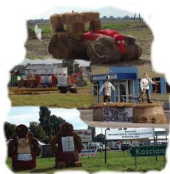
Dekoracje na ujazdach do miasta przygotowane zostały przez rolników z gmin naszego powiatu