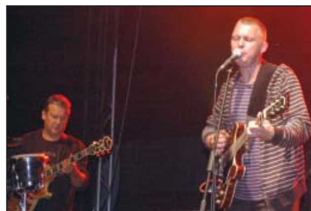
Gwiazda wieczoru Raz Dwa Trzy