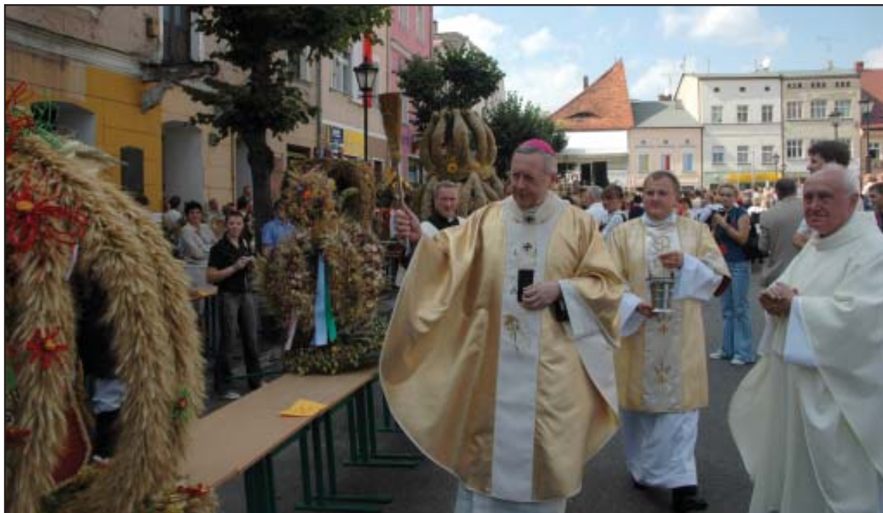
Poświęcenie wieńców dożynkowych