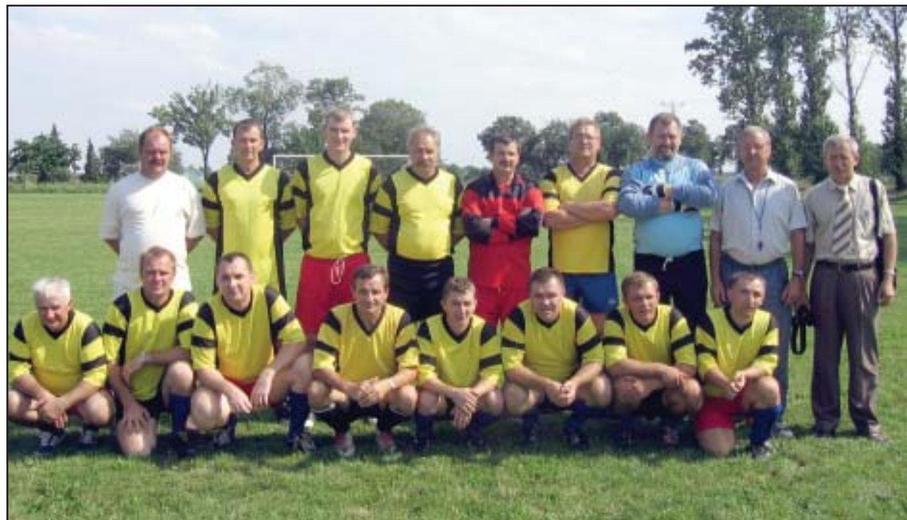
Drużyna Old-Boys Gryżyna