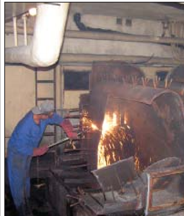
Demontaż starego pieca w Zespole Szkół nr 3

Formularze wniosków o udzielenie stypendium można otrzymać w Punkcie Informacyjnym Urzędu Miejskiego Kościana, Al. Kościuszki 22, w Zespołach Szkół nr 1, 2, 3, 4, I Liceum Ogólnokształcącym w Kościanie oraz na www.koscian.pl krs