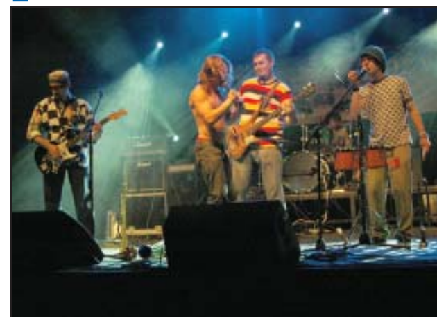
Rockowa Rura z Ukrainy