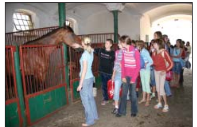
Zwiedzanie Stadniny Koni w Racocie.

Gimnazjum im. Polskich Olimpijczyków w Racocie zorganizowało w terminie 20-24 sierpnia 2007r. „Szkołę Letnią” dla uczniów, którzy od września będą uczęszczać do tej placówki. Celem tego przedsięwzięcia była integracja pierwszoklasistów, poznanie piękna Ziemi Kościańskiej, wspólne zabawy i rekreacja. Zajęcia prowadzone codziennie przez różnych nauczycieli gimnazjum miały charakter wyjazdowy i wzięło w nich udział 55 uczniów z obwodu szkolnego. Uczestnicy zwiedzili Stadninę Koni w Racocie, odbyli przejażdżkę bryczkami, pływali motorówką i rowerami wodnymi w Nowym Dębcu, byli w kinie w Poznaniu, zwiedzili Centrum Szybocowe w Lesznie, byli gośćmi Radia ELKA i redakcji ABC, skorzystali z kąpieli na kościańskiej pływalni i atrakcji klubu „Nenufar”.