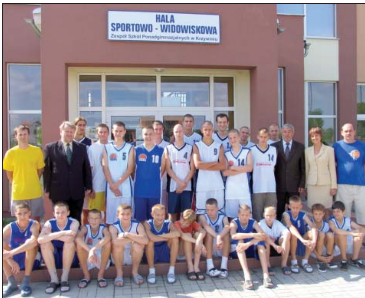
Wicestarosta Kościański spotkał się z uczestnikami sportowego obozu.