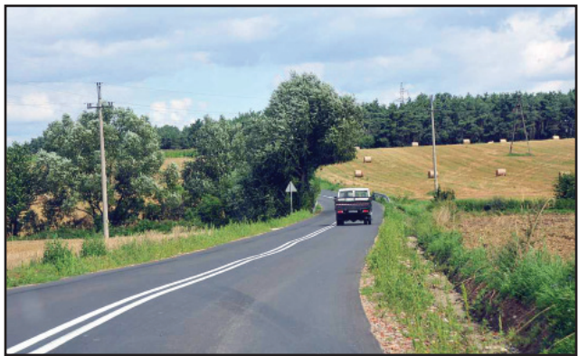
Cała trasa zyskała nową nawierzchnię bitumiczną oraz oznakowanie poziome.