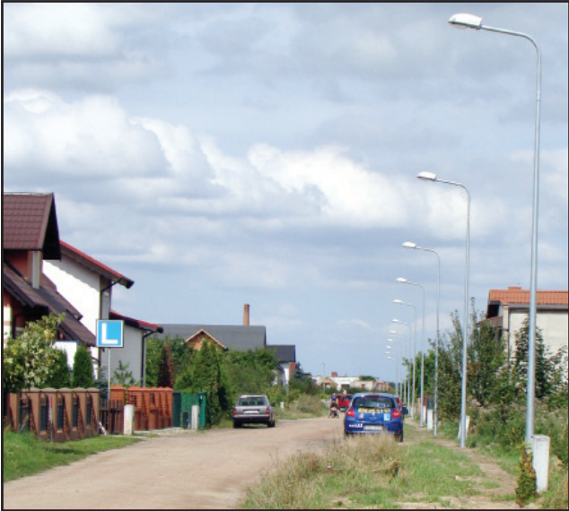
W ulicach Wojciechowskiego i Balcera ustawiono 42 lampy.