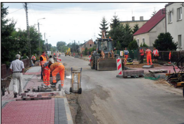
Prace w miejscowości Pelikan

W ubiegłym tygodniu rozpoczął się także remont odcinka drogi Krzywiń – Żelazno – Lubiń w miejscowości Wieszkowo. Podczas prac zostanie zainstalowana kanalizacja deszczowa. Oprócz nowej nawierzchni powstaną także chodniki oraz wjazdy do posesji. Koszt prac to prawie 290 tys. złotych. Roboty wykonuje firma „POL-DRÓG Kościan Sp. z o.o.