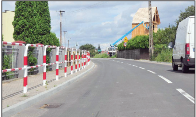
Barierki zabezpieczające pieszych w Krzywiniu.