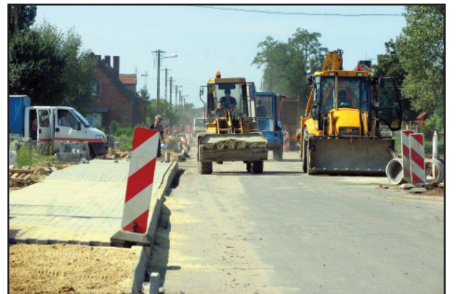
Prace w Przysieci