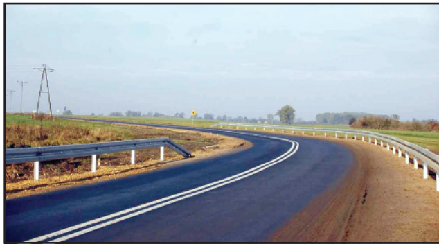
W niebezpiecznych miejscach zamontowano bariery energochłonne.