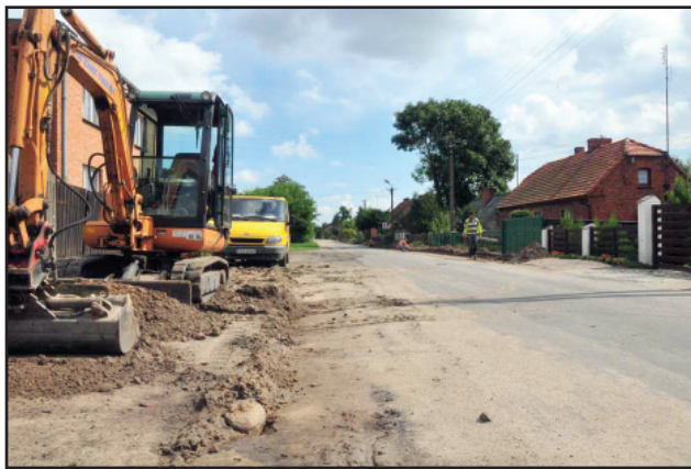
Przygotowania do robót w Wieszkowie