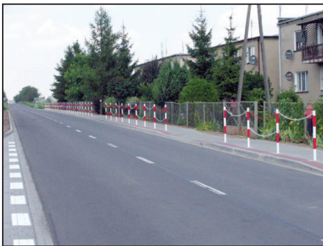
Barierki ochronne w Osieku

Podczas prac na trasie Gryżyna – Krzywiń, na całym, 11 kilometrowym odcinku wzmocniono pobocza i położono nową nawierzchnię bitumiczną. W Osieku, Januszewie, Świńcu i Jurkowie przebudowano chodniki oraz utworzono zatoki autobusowe, ponadto w Jurkowie i Januszewie powstały wyniesione przejścia dla pieszych. W samym Jurkowie zmodernizowano zakręt, co znacznie poprawiło bezpieczeństwo kierowców i pieszych.