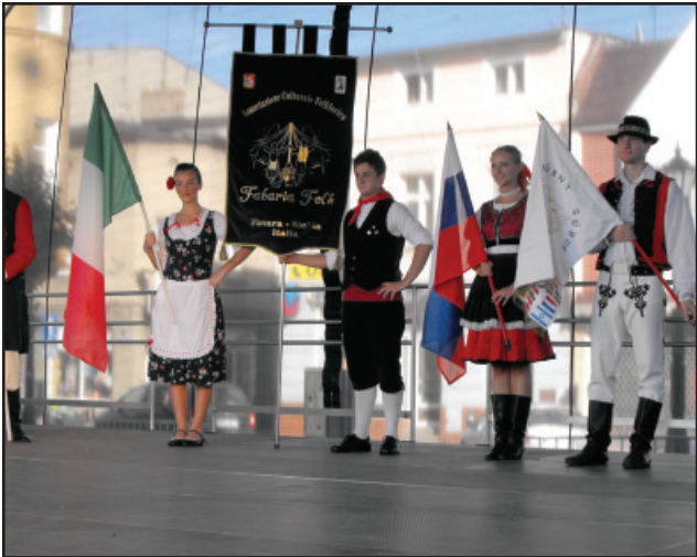
W sobotnie popołudnie na kościańskim rynku w ramach III Międzynarodowego Spotkania Folklorystycznego „Pociągiem do folkloru” zaprezentował się m.in. zespół folklorystyczny z Włoch.

W piątek 27 sierpnia br. o godz. 20.00 zostanie wyświetlony czwarty już film w ramach plenerowego Kina Letniego pt. „Mroczny przedmiot pożądania”. Tym razem będzie to francusko-niemiecki dramat w reżyserii Luisa Buñuelu. Serdecznie zapraszamy.