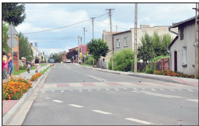
W Jurkowie powstały 2 wyniesione przejścia dla pieszych.