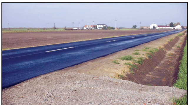
Wyremontowany w 2009 roku odcinek Czarkowo - Gryżyna

Zakończony w październiku ubiegłego roku remont drogi z Czarkowa do Gryżyny był początkiem jednej z największych inwestycji drogowych w powiecie. Dobiegł końca także drugi etap prac: remont trasy Gryżyna – Krzywiń. Koszt remontu całego odcinka to ponad 8 mln złotych. Część tej kwoty udało się pozyskać ze środków zewnętrznych.