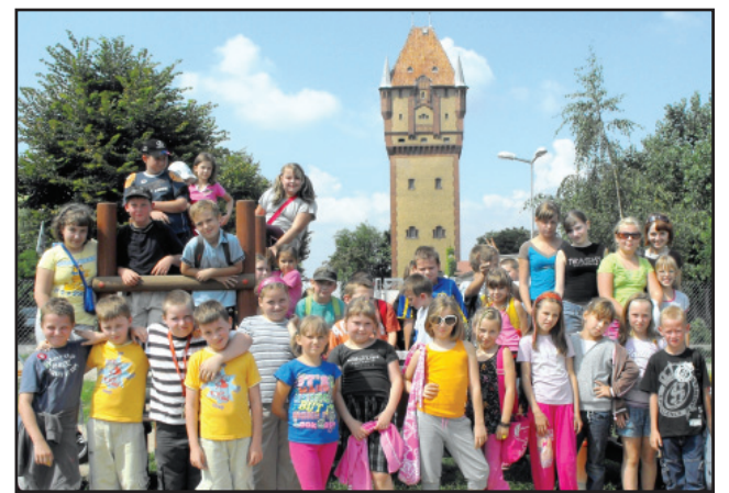
Dzieci z Kościana podczas mijających wakacji atrakcyjnie spędzali swój wolny czas.

Jak co roku dla dzieci zorganizowano zajęcia w kościańskich szkołach, a także półkolonie i obozy. Przez pierwsze dwa tygodnie sierpnia br. w ramach akcji „Lato w KOK” młodzi kościaniacy mogli uczestniczyć m.in. w zorganizowanych przez Kościański Ośrodek Kultury zajęciach na strzelnicy prowadzonych przez członków Klubu Żołnierzy Rezerwy LOK. Ponadto przygotowano zajęcia rozwijające uzdolnienia artystyczne w tym plastyczne i teatralne, a także zorganizowano wycieczkę do kina oraz Skansenu Miniatur w Pobiedziskach i Parku Dinozaurów „Zaurolandia” w Rogowie.