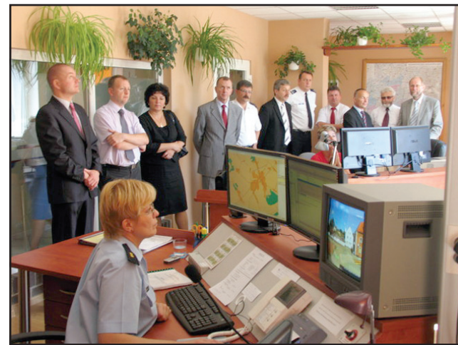
Inauguracja działalności Zintegrowanego Stanowiska Dyspozytorskiego