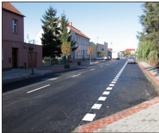
Zakończono pierwszy etap remontu ul. Sierakowskiego w Kościanie.