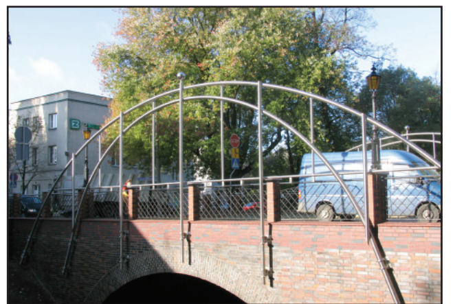
W Kościanie wyremontowano most i aleje T. Kościuszki.