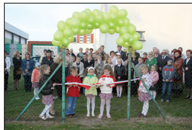
Otwarcie placu zabaw dla dzieci.

Ostatnim punktem sobotniego programu uroczystości było otwarcie i poświęcenie placu zabaw dla dzieci na terenie szkolnym. Plac zabaw został ufundowany ze środków Gminnej Komisji Rozwiązywania Problemów Alkoholowych. Przecięcia wstęgi dokonali użytkownicy tego miejsca rekreacji, czyli przedszkolaki z Bonikowa. (mn)