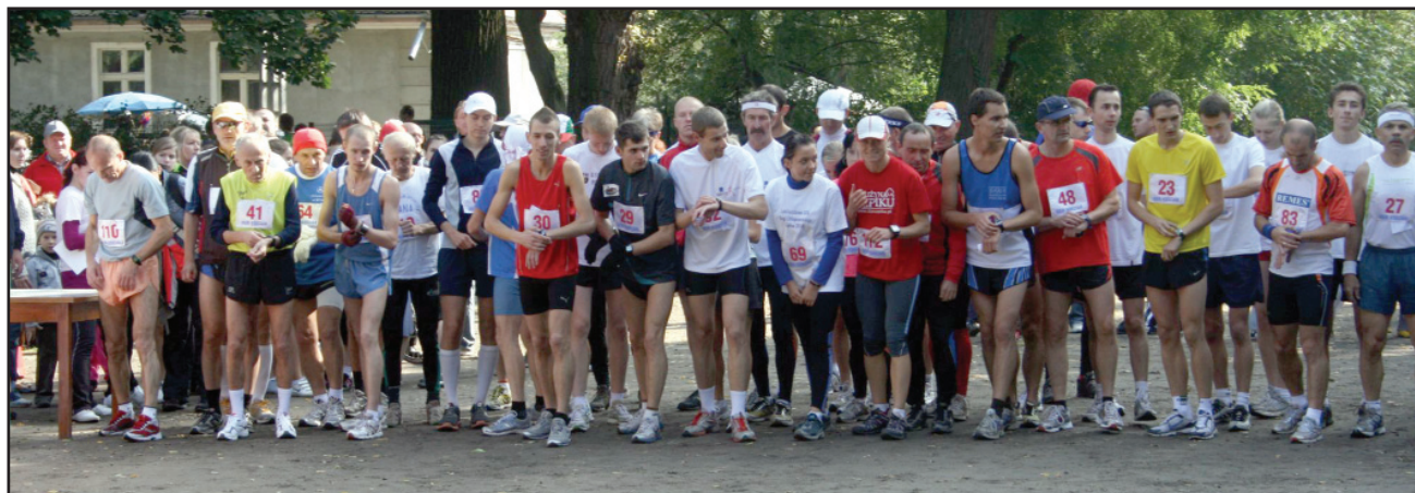
Start do biegu głównego na 10 km

Powiatowe Stowarzyszenie LZS w Kościanie, Ośrodek Sportu i Rekreacji w Kościanie, Klub Strzelecki w Widziszewie zapraszają na