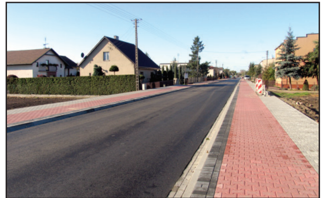
Droga w Pelikanie ma nową nawierzchnię.