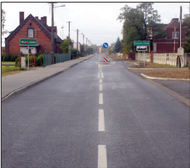
Wyremontowano 5 km drogi Czacz – Widziszewo.

Poza Kościanem zakończono prace na drodze Kokorzyn – Kościan, we wsi Pelikan. Ponad kilometrowy odcinek drogi został poszerzony, ma nową nawierzchnię, dla bezpieczeństwa pieszych i rowerzystów powstały ciągi pieszo-rowerowe. Wykonane prace mają wartość ponad 1 miliona 687 tys. złotych. bj