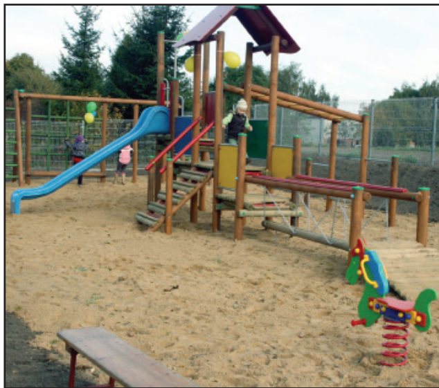
Plac w Naclawiu

kowych. Dorośli znajdą odpoczynek w specjalnie przygotowanym aneksie rekreacyjno - wypoczynkowym w postaci altany ogrodowej wraz z zamontowanymi ławkami oraz stanowiskami do gry w szachy i kości. Całkowity koszt tej inwestycji to 149.589, 62 zł. (mn)