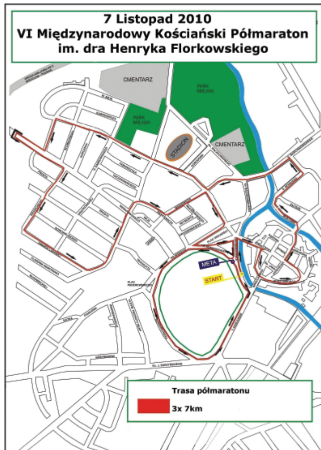
Trasa VI MIĘDZYNARODOWEGO KOŚCIAŃSKIEGO PÓLMARATONU im. dra HENRYKA FLORKOWSKIEGO

Biuro zawodów czynne będzie od godz. 9.00 do 12.00 - ok. 150 m od linii startu, w I Liceum Ogólnokształcącym im Oskara Kolberga w Kościanie Al. Kościuszki 3, gdzie znajdować się będą szatnie dla zawodników oraz będzie miało miejsce wydawanie posiłków po biegu.