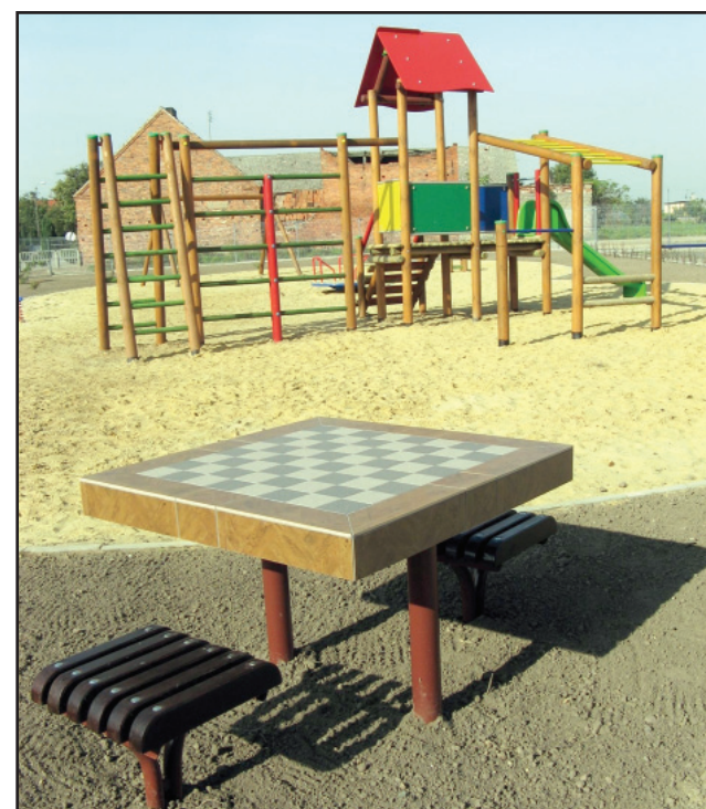
Plac w Starym Luboszu