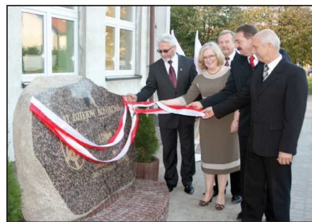
Odsłonięcie pamiątkowego kamienia.