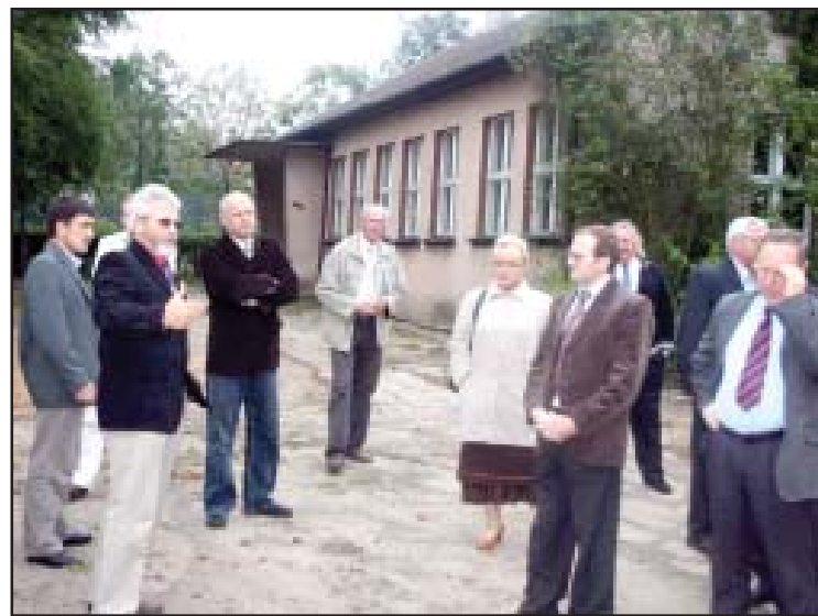
Szkola w Katarzyninie