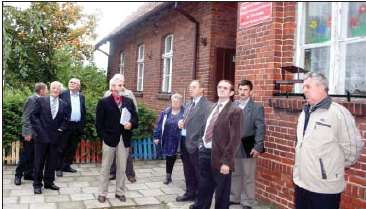
Szkola w Gryżynie