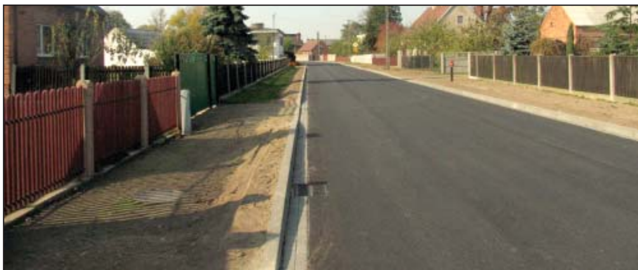
Nowa droga w Łuszkowie kosztowała ponad milion złotych.

Te dwie wyremontowane drogi to nie jedyne inwestycje zakończone jesienią tego roku. Przypominamy, że w zeszłym miesiącu zakończył się remont 200 metrów jezdni w Sławiu w gminie Śmigiel. Koszt remontu niebezpiecznego zakrętu w tej miejscowości wyniósł ponad 323 tys. złotych z czego ponad 200 tys. złotych powiat otrzymał od gminy Śmigiel. bj