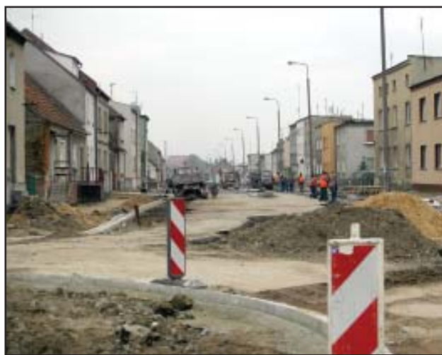
Remont ulicy Poznańskiej w Kościanie to największa inwestycja powiatu w tym roku.

Modernizacja i budowa ulicy Poznańskiej w Kościanie to największa tegoroczna inwestycja drogowa Starostwa Powiatowego w Kościanie. bj