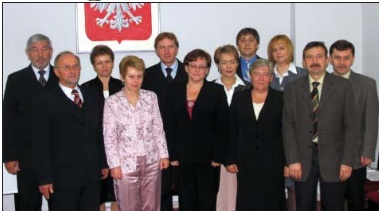
Z okazji Dnia Edukacji Narodowej Starostowie Kościańscy nagrodzili nauczycieli pracujących w szkołach prowadzonych przez powiat.

Powiatowy Urząd Pracy w Kościanie informuje, iż dysponuje środkami Państwowego Funduszu Rehabilitacji Osób Niepełnosprawnych dla Pracodawców zamierzających zatrudnić osoby niepełnosprawne oraz dla osób niepełnosprawnych zamierzających podjąć własną działalność gospodarczą. Szczegółowych informacji udziela Powiatowy Urząd Pracy w Kościanie pod numerem (065) 512-10-55.