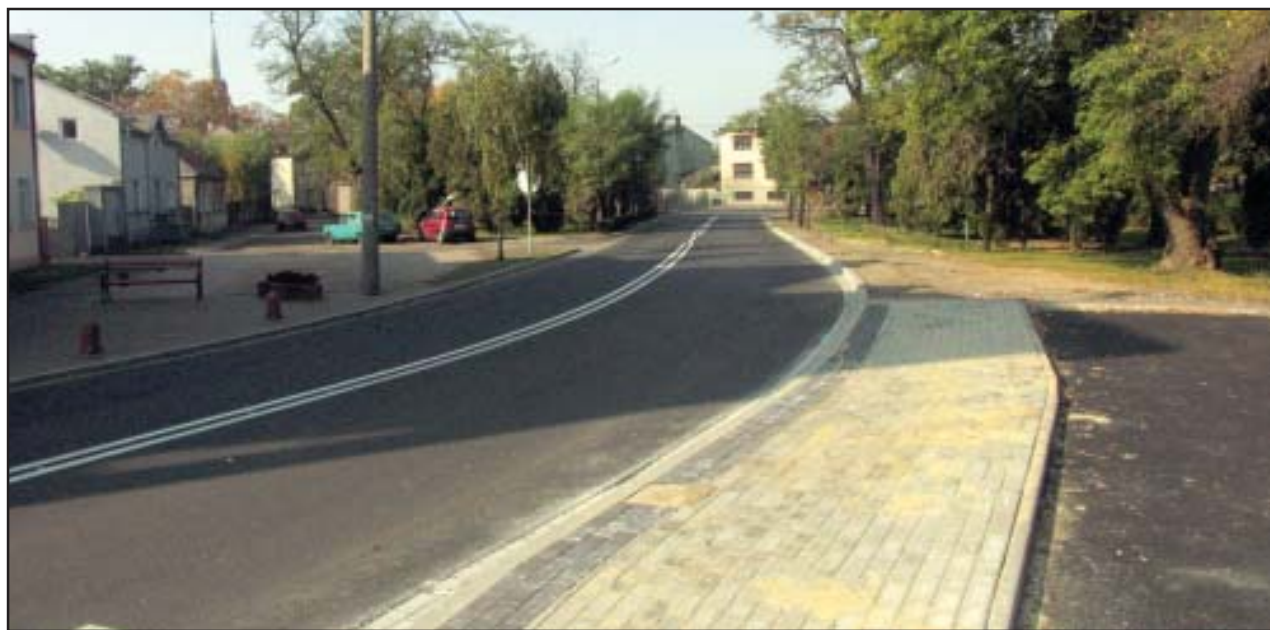
Po remoncie ulica Stare Borówko w Czempiniu jest bezpieczniejsza.