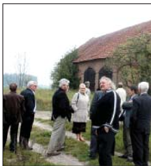
Stodola w Graneczniku