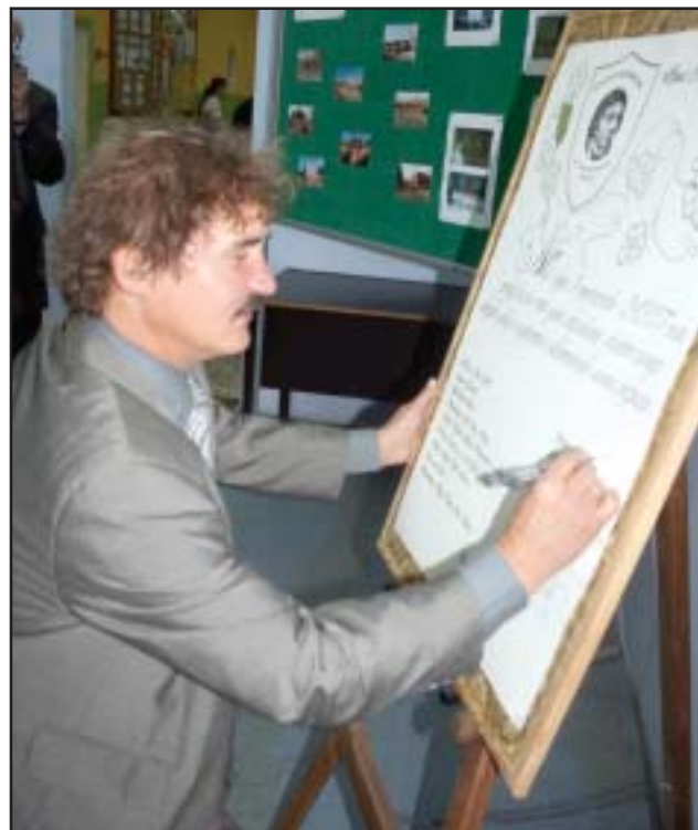
Podpisanie okolicznościowego aktu