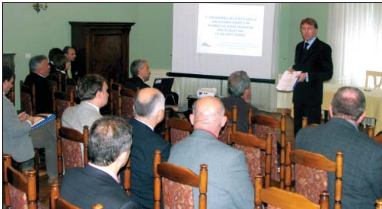
Starosta Andrzej Jęcz zachęcał przedsiębiorców do współdziałania.