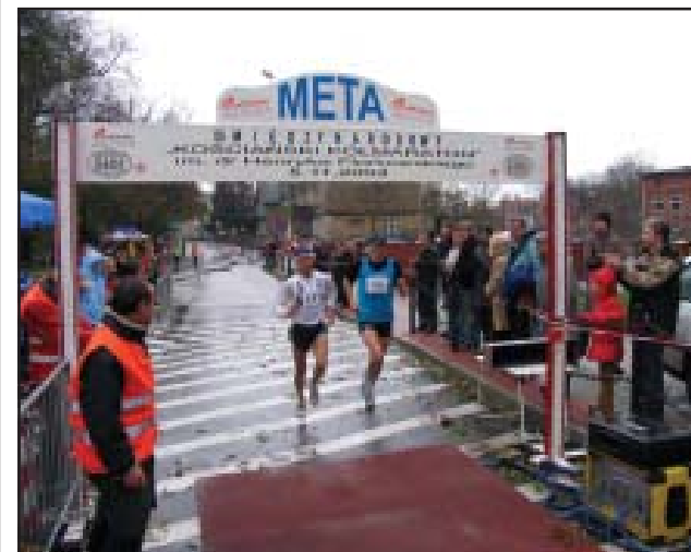
W tym roku znów jest szansa na wielkie zwycięstwo.

Szczegółowe informacje na temat Półmaratonu, regulamin, trasę można znaleźć na stronie www.powiatkościan.pl bj