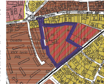
WYRYS ZE STUDIUM UWARUNKOWAŃ I KIERUNKÓW ZAGOSPODAROWANIA PRZESTRZENNEGO KOŚCIANA SKALA 1:5 000